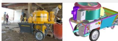
Dosificador de Agua (opcional)

Mezclador planetario de 80 l perfecto para materiales que requieran tiempos de mezcla más largos